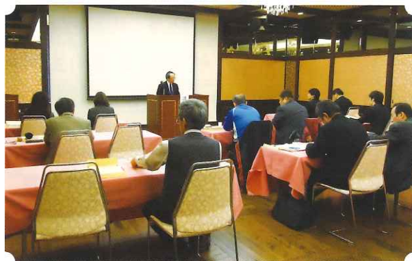
養成講習を受講されている新任特相員の方々

今年度も、新たに7名の方に委嘱されることとなり、本年2月に養成講習会が開催され、4月1日付けで岐阜県知事から委嘱状が交付されました。今後の皆様のご活躍を期待します。