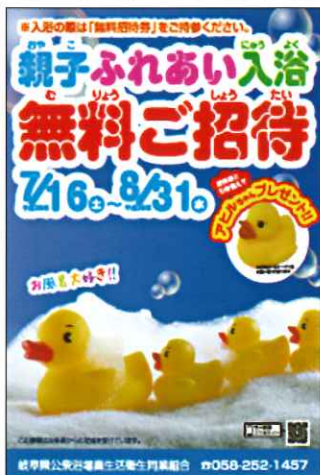
親子ふれあい入浴ポスター

さて、皆さんは銭湯というと「スーパー銭湯」を想像されませんか？私共公共浴場業は、昔ながらの「お風呂屋さん＝銭湯」で、物価統制令により、いまでも県内は大人420円に統一されています。そして、まさに公共衛生のために日々生懸命営業を行っているところです。県との連携では、毎年『親子ふれあい入浴』事業を推進しており、幼稚園・保育園に、親子でお風呂に入