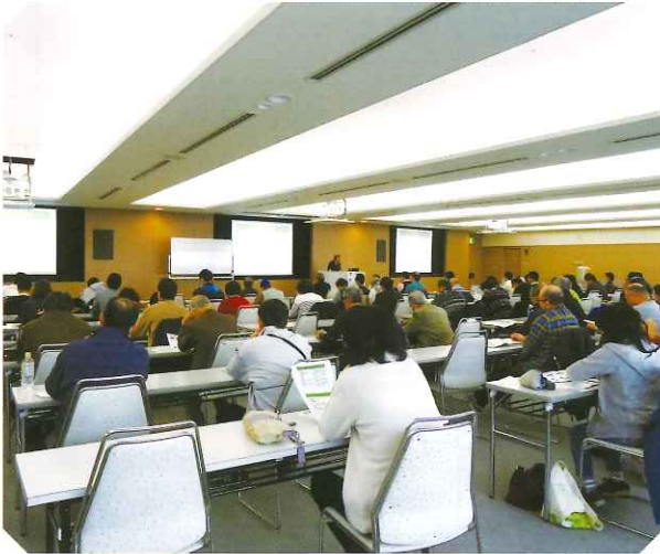
クリーニング師研修会の様子 (28年度岐阜会場)

平成28年12月から、衣類等の繊維製品の洗濯表示が、新しいJIS L 0001 (新JIS) に変更されました。新JISでは、記号の種類が22種類から41種類に増え、繊維製品の取扱いに関するより細かい情報が提供されるようになりました。今年度の研修では、この「新JIS」について詳しく解説します。また、平成27年10月に改訂された「クリーニング事故賠償基準」の改正ポイントについても解説します。