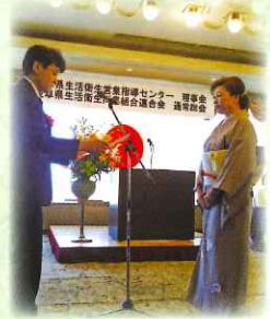
表彰状を授与される 受賞者の方