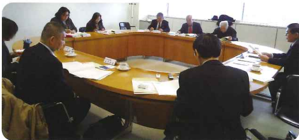
消費者問題について協議を行う関係者

もう一つの問題として、最近増加しているものに「不当表示」の事例が増えており、不当な取引を排除し消費者を保護するためにも、景品表示法の遵守の必要が最近大きく問題となっていることの説明がありました。