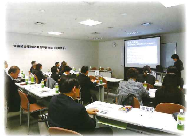
福岡県美容組合の事例発表

そして、今回特に、組合活性化活動の事例紹介として、全国でも有効な成果を挙げている福岡県美容組合の事務局経営企画次長さんにお越し頂き、組合の加入勧奨活動の具体的な取組内容について紹介頂き、各々の組合活動を行うにあたっての参考事例として、種々意見交換も交えながら講義していただきました。